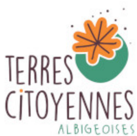
logo_TCA_150.jpg ~23 ko